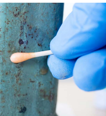
Oranje = geen chroom-6 Chroom-6 test op verflagen